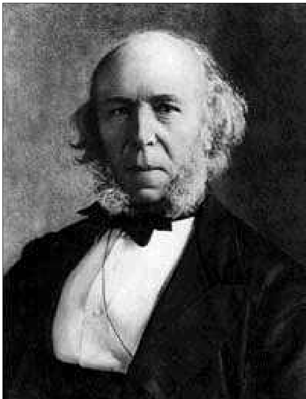
Herbert Spencer (1820-1903) var højt agtet af Charles Darwin og blev tidligt talsmand for darwinistisk teori om moralens oprindelse. Spencers teori er nu stort set opgivet.

menneskets moralske grundlov – ved hjælp af aktive intellektuelle evner og vanens virkning naturligt fører til den gyldne lov: 'Gør mod andre, som du vil, at andre skal gøre mod dig', og dette er moralens grundlov. [Julian Huxley, Darwin , Martins Forlag 1940, p. 163]