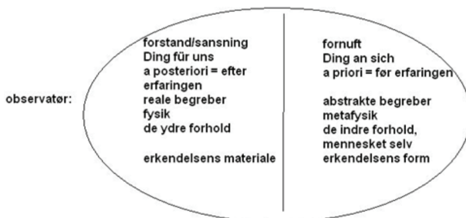
Figur 2. Anskuelse/observation/empiri.

http://da.wikipedia.org/wiki/Immanuel_Kant http://commons.wikimedia.org/wiki/File:Immanuel_Kant_(painted_portrait).jpg http://www.denstoredanske.dk/Sprog,_religion_og_filosofi/Filosofi/Oplysningstiden,_engelsk_deisme_og_kritisk_filosofi/Filosoffer_1700-t._-_Tyskland_-_biografier/Immanuel_Kant http://de.wikipedia.org/wiki/Albertus-Universit%C3%A4t_K%C3%B6nigsberg#Philosophie_und_Literatur http://en.wikipedia.org/wiki/Immanuel_Kant_Baltic_Federal_University